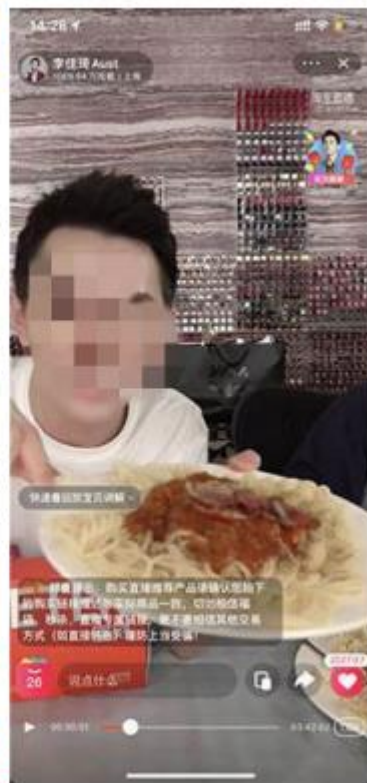
图 8-36 美食直播画面