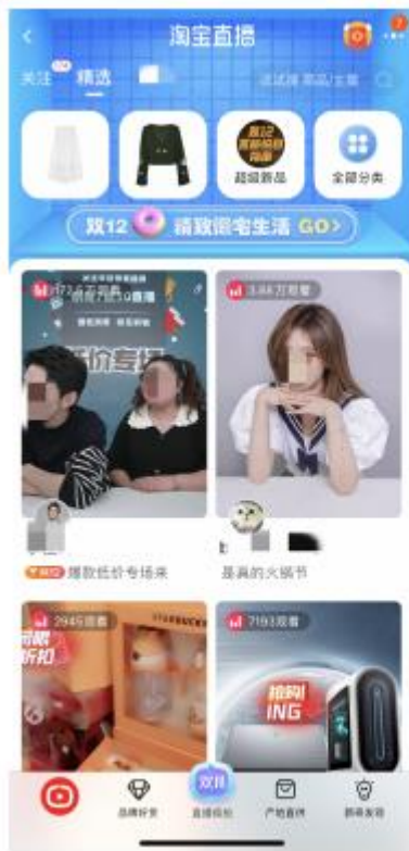
图 8-34 直播封面

目前的直播营销，从广义上来理解，可以看作是以直播平台为载体进行营销活动，达到提升品牌形象或增加销量的一种网络营销方式。