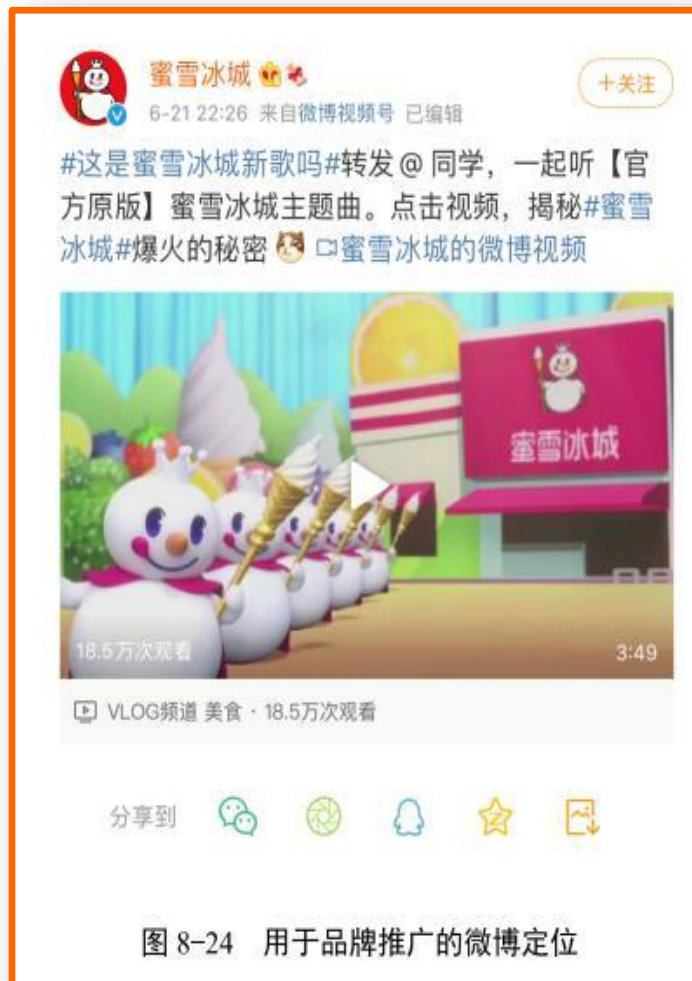
图 8-24 用于品牌推广的微博定位