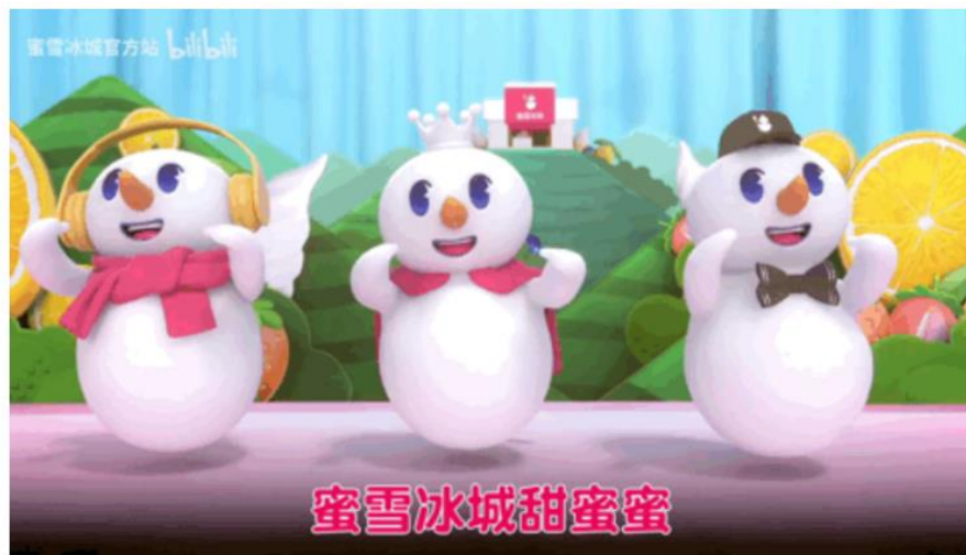
图 8-33 与视频内容融合的推广文案