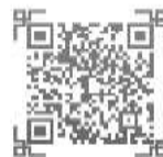
韵及韵部相关知识

古代的韵部有很多，据古诗词创作韵部查询用书——南宋刘渊的《平水韵》记载，有106个韵部，分别是平声韵30个，上声韵29个，去声韵30个，入声韵17个。