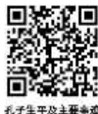
孔子生平及主要事迹

上文选自《论语·公冶长篇》，记录了孔子及弟子子路和颜渊的日常互动。作品中，师徒三人各自抒发了自己的人生理想。