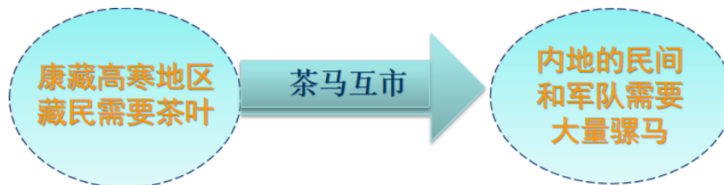
图6 茶马古道的起源

酥油茶的高原生活习惯，但藏区不产茶。而在内地，民间役使和军队征战都需要大量的骡马，但供不应求，而藏区和川、滇等地区则出产良马。于是，具有互补性的茶和马的交易即“茶马互市”便应运而生。这样，藏区和川、滇边地出产的骡马、毛皮、药材等和川、滇及内地出产的茶叶、布匹、盐和日用器皿等等，在横断山区的高山深谷间南来北往，流动不息，并随着社会经济的发展而日趋繁荣，形成一条延续至今的“茶马古道”。