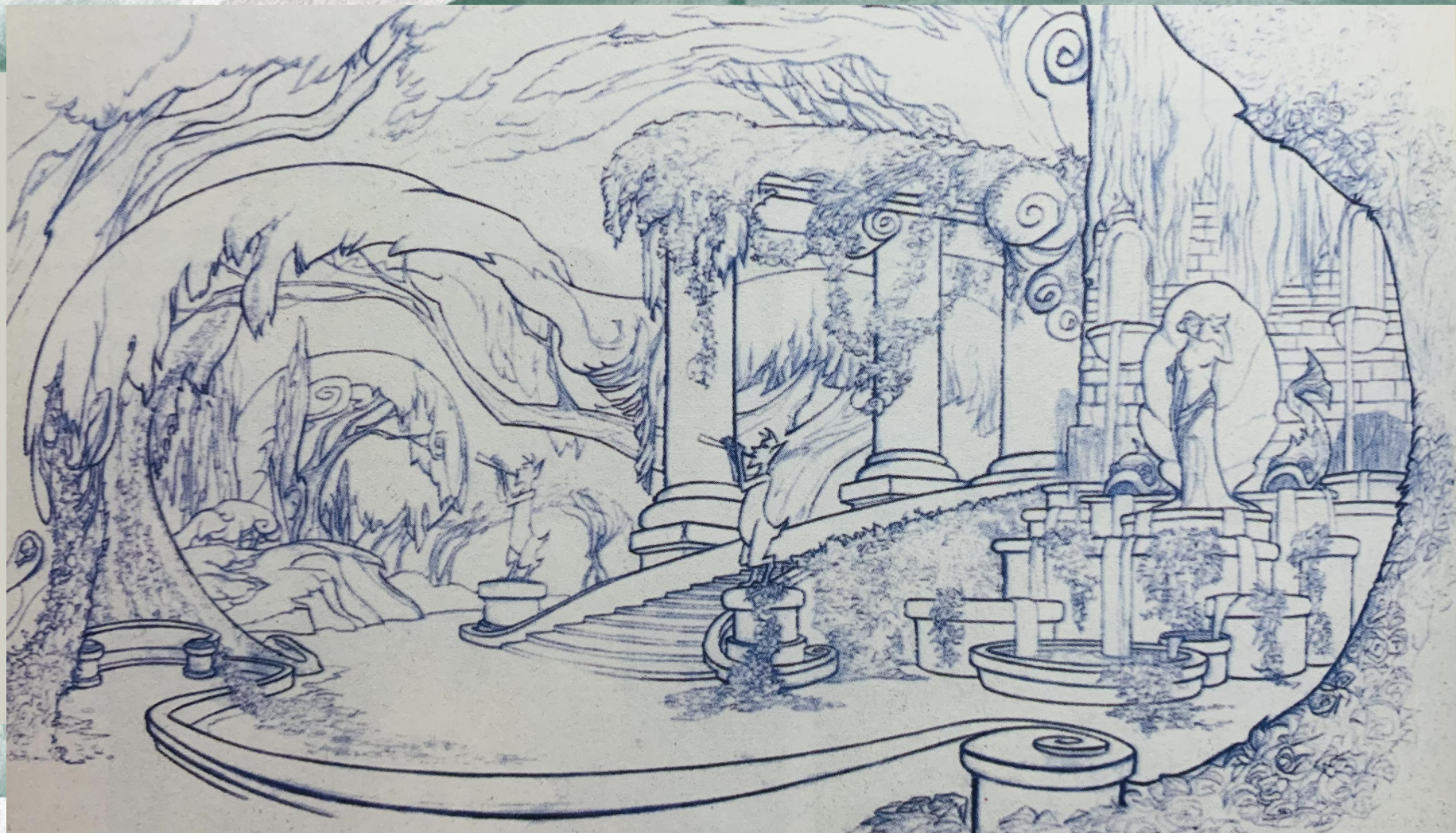
动画片《大力士》一个花园设计的草图

动画场景设计首先从剧本出发、从生活出发，熟读理解剧本；明确历史背景、时代特征；明确地域特色；分析人物；明确影片类型风格；深入生活，搜集素材。