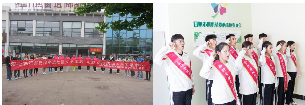
学生积极参与校内、校外社会实践活动

课前，学生通过课程平台预习课程内容，并观看疫情时期先进人物、典型事迹案例，为课上教学的实施奠定基础，同时培养了学生的自主学习能力；课中通过案例教学、同伴教学等方法，强化学生社会主义核心价值观和职业素养的培养；课后通过参与社会调查、日照市四叶草爱心志愿者协会志愿服务活动、清雅堂人文素养课堂、职业素养大赛等第二课堂活动，在获得实践时常积分提高《管理学》课程成绩的同时，培养学生的综合素养，为学生勇于担当责任，更好的服务、奉献社会奠定基础。