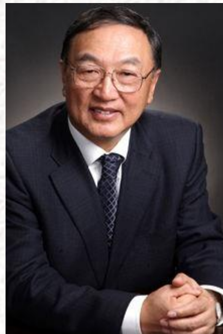
联想创始人：柳传志