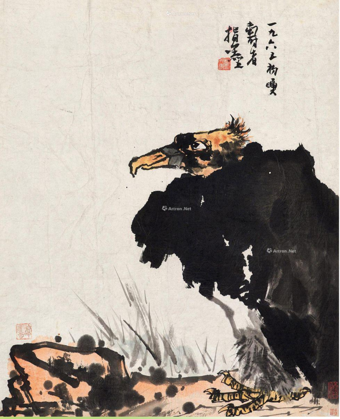
潘天寿画雁图 一九六五年作于上海