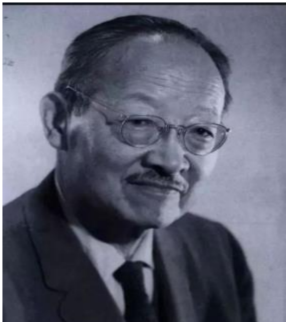
现代语言学大师， 会40多种语言