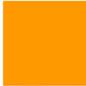
amazon orange 亚马逊 橙色 #ff9900