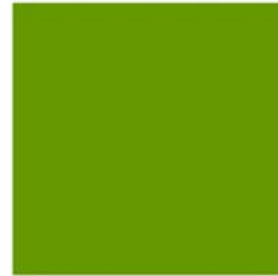
amazon cactus 亚马逊 仙人掌绿 #669900