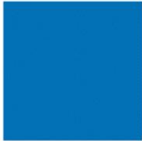
amazongateway blue 亚马逊 蓝色 #006699