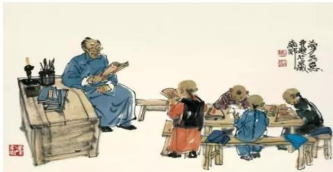
日职创院国学教育