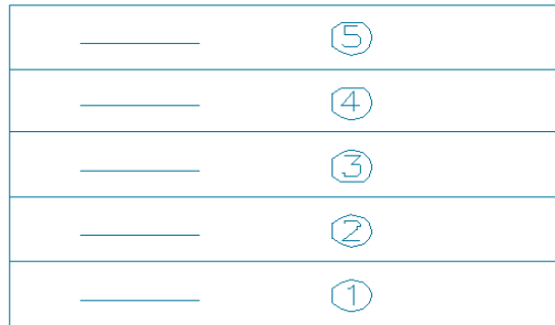
图 5.1.2-1 整体分层连续浇筑施工

5.1.2 大体积混凝土工程的施工宜采用整体分层连续浇筑施工(图5.1.2-1)或推移式连续浇筑施工(图5.1.2-2)。