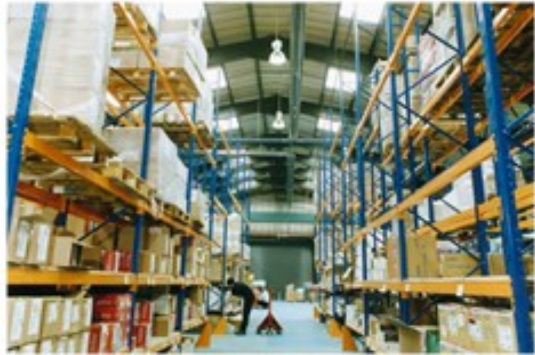
图 5-8 货架型仓库