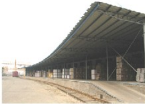
图 5-5 货棚