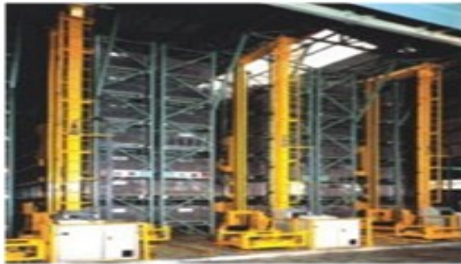
图 5-9 自动化立体仓库