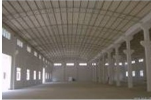
图 5-4 封闭式仓库