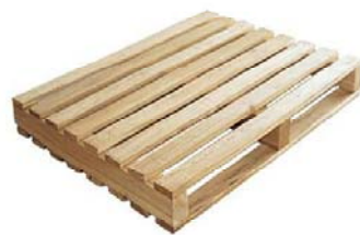
图 5-22 双面使用型