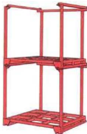
图 5-32 柱式托盘