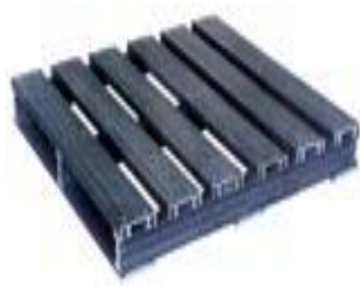
图 5-20 平托盘