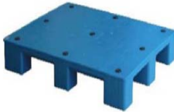
图 5-26 平板型塑料托盘