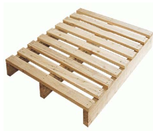
图 5-21 单面使用型