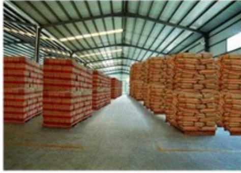
图 5-7 地面型仓库