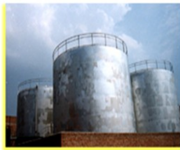
图 5-12 罐式仓库