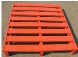
图 5-23 翼型托盘