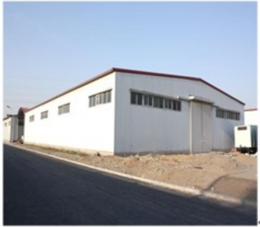
图 5-10 平房仓库