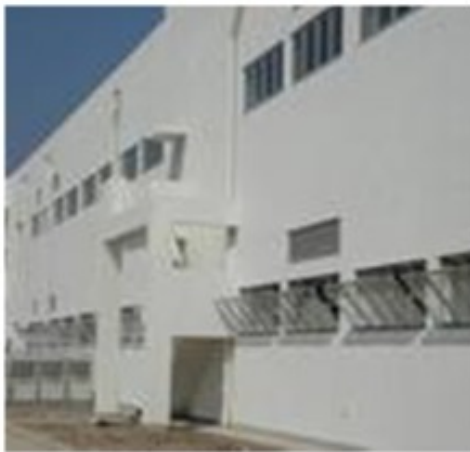
图 5-11 楼房仓库