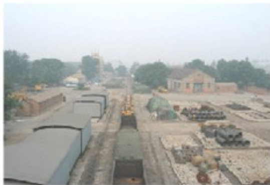
图 5-6 露天货场