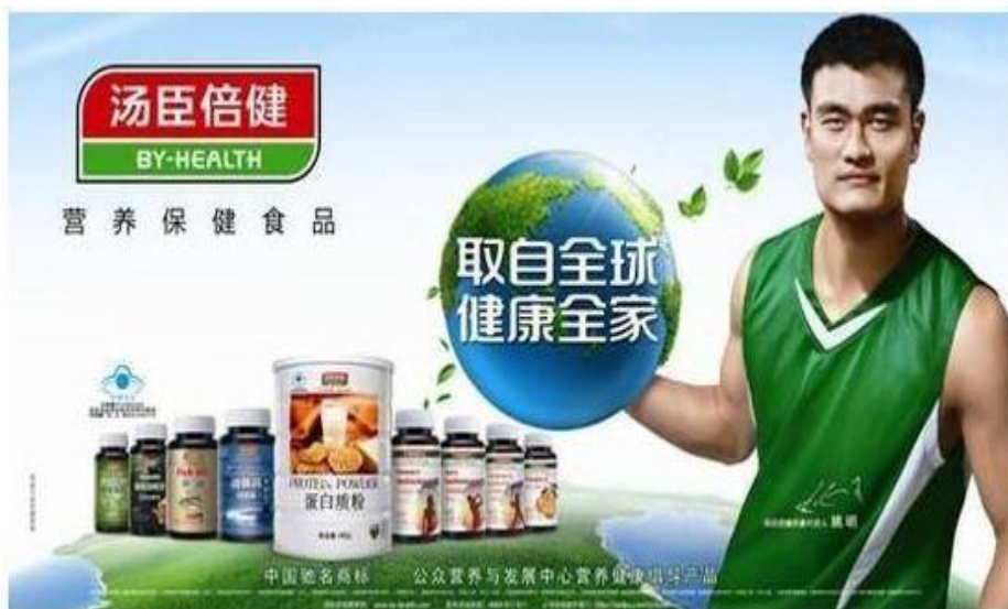
姚明代言汤臣倍健