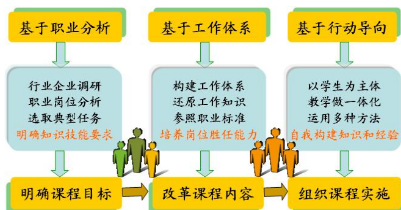
图3 《经济学基础》课程设计理念

课程团队以校企合作为基础，以培养学生职业能力为核心，围绕专业人才培养目标，进行了充分的行业企业调研。基于职业岗位分析明确课程目标和定位，基于工作体系改革课程内容，基于行动导向设计教学模式，形成了《经济学基础》课程的设计理念和思路。