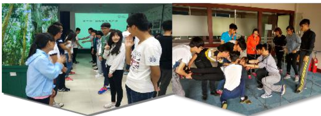
图 5 学生第二课堂拓展

课程的有效实施，在于两个课堂的结合：第一课堂和第二课堂的结合和相互补充。第一课堂以教学为主要任务；第二课堂则是对第一课堂的有益补充，弥补了第一课堂灵活性差，实践能力弱的缺点。自 2013 年起，合作企业亚太森博和新模式咨询参与到了第二课堂，大大提高了学生的实践能力。