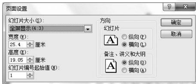
图5-42 “页面设置”对话框

在“幻灯片母版”选项卡中还可以对其进行页面设置。单击“页面设置”组中的“页面设置”命令会弹出“页面设置”对话框，如图5-42所示。在该对话框中可设置幻灯片大小、方向、起始编号等。