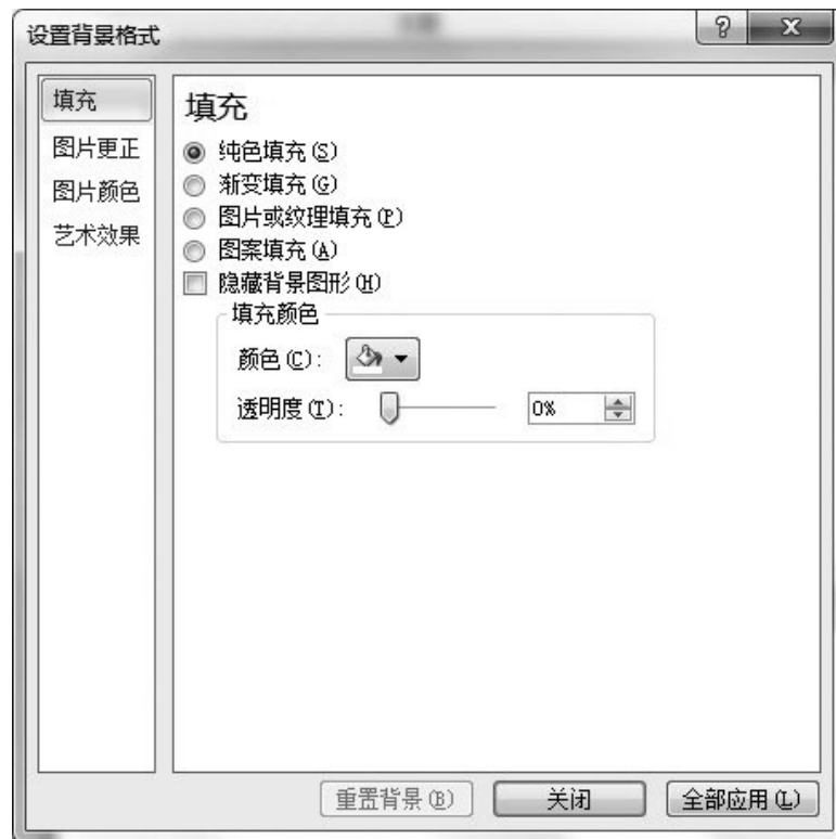
图5-39 “设置背景格式”对话框