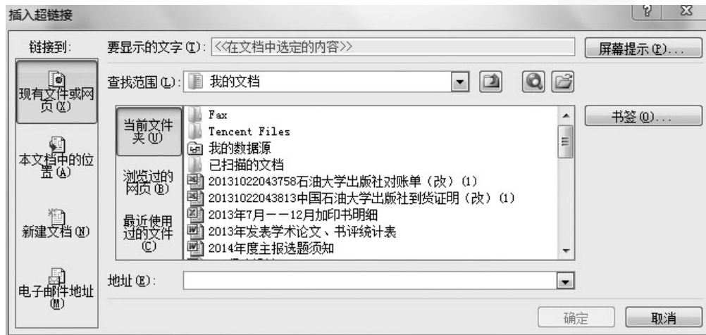
图5-47 “插入超链接”对话框

插入超链接时，首先选中要插入超链接的对象，然后切换到“插入”选项卡，单击“链接”组中的“超链接”命令，这时会弹出“插入超链接”对话框，如图5-47所示。