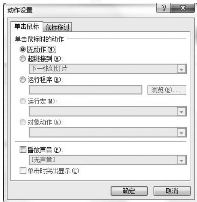
图5-49 “动作设置”对话框

在“单击鼠标”选项卡中选择“超链接到”单选按钮，在下面的下拉列表框中可以选择超链接的对象，操作方法与前面介绍的超链接的内容基本一致，在此不再赘述。若选择“运行程序”单选按钮，则表示放映时单击对象会自动运行所选的应用程序，用户可在文本框中输入要运行的程序及其完整路径，或单击“浏览”按钮选择。