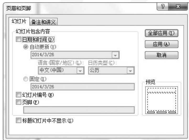
图5-54 “页眉和页脚”对话框