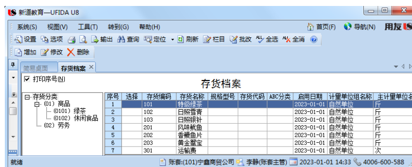
图 1.3.31 存货档案列表