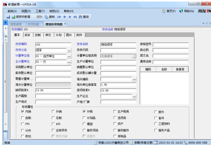
图 1.3.30 增加存货档案

(2) 执行【存货】-【存货档案】命令，打开【存货档案】窗口，单击【增加】按钮，打开【增加存货档案】窗口，根据表 1.3.16 所示信息，录入存货编码、存货名称，选择存货分类、计量单位组、主计量单位信息，将【销项税率%】和【进项税率%】更改为“13”，勾选存货属性，如图 1.3.30 所示。