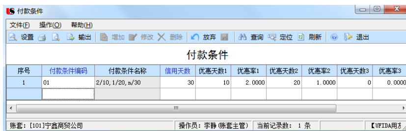
图 1.3.25 付款条件