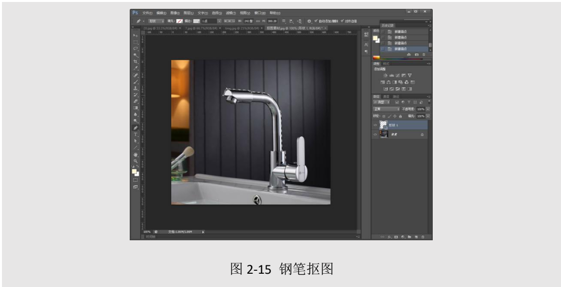
图 2-15 钢笔抠图

(1) 钢笔抠图 ：使用钢笔工具，配合 Alt 和 Ctrl 按键将需要的轮廓抠出，按 Ctrl+Enetr 转换为选区，使用移动工具移出即可。钢笔抠图在曲线的平滑度上是其他抠图方法所无法比拟的。