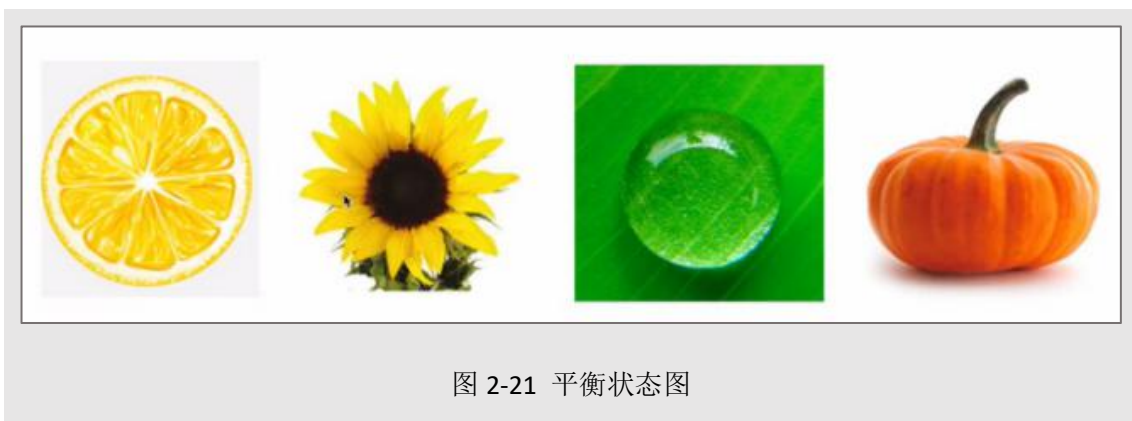
图 2-21 平衡状态图

4、 Banner 构图类型 ：在设计 Banner 时，版式的平衡对称稳静感很重要，我们的目光聚集在图片的中心位置是感觉最舒服的。