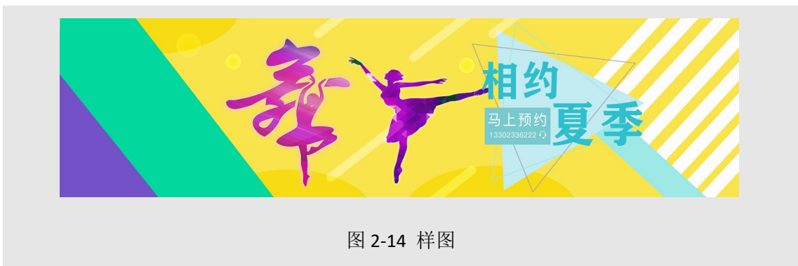
图 2-14 样图