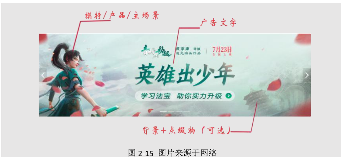
图 2-15