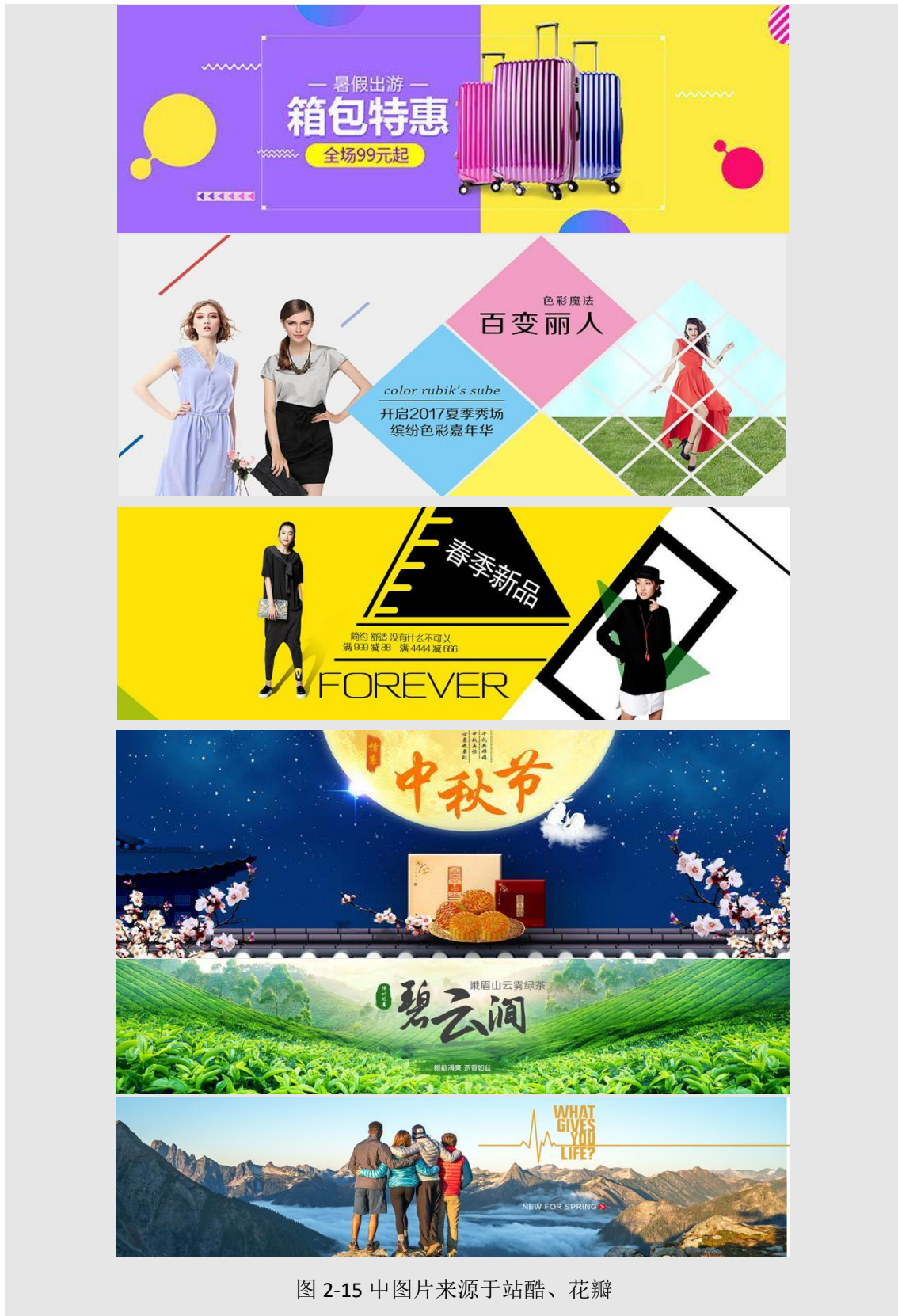
图 2-15 中图片来源于站酷、花瓣

⑤ 满版型：整个版面以图像充满，以图像为诉求，视觉传达更强烈直观，给人大方、舒适的视觉体验。此种 Banner 对背景配图要求比较高，要选高清大图。