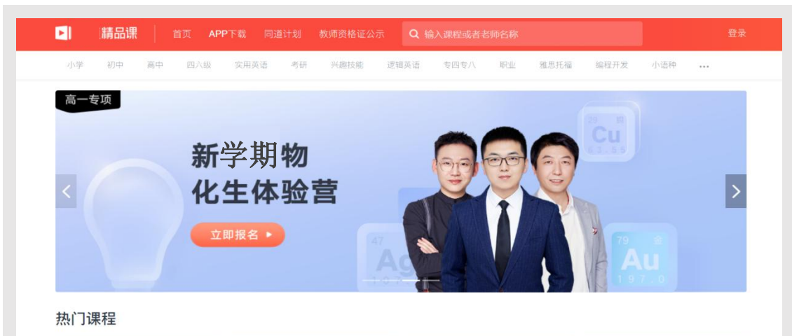
图 2-15

确表达所需要的信息。Banner 的设计一般比较醒目，主要为了吸引客户，抓住客户的眼球，产生流量转化。