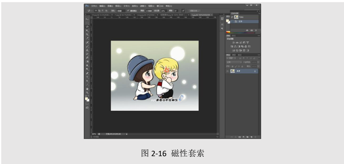
图 2-16 磁性套索

(2) 磁性套索 ：边界与背景区分明显的图片可以使用磁性套索抠图，磁性套索具有自动吸附功能，可以吸附在图片边界，要飘走使点击鼠标左键加控制点，闭合后形成选区，使用移动工具移出。