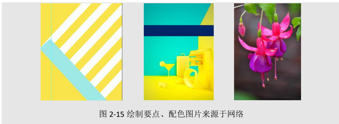
图 2-15 绘制要点、配色图片来源于网络

本任务在设计的舞者招生宣传 Banner 中，通过钢笔工具、形状工具、自由变换及变换复制的使用，灵活进行区域划分及点缀实现。为确保所有形状在 Banner 区域内显示，运用了图层蒙版。文案的实现运用了特殊字体，常见 Banner 用字字体的选择，也是 Banner 绘制需要注意的知识点，变换复制：Ctrl+Shift+Alt+T。