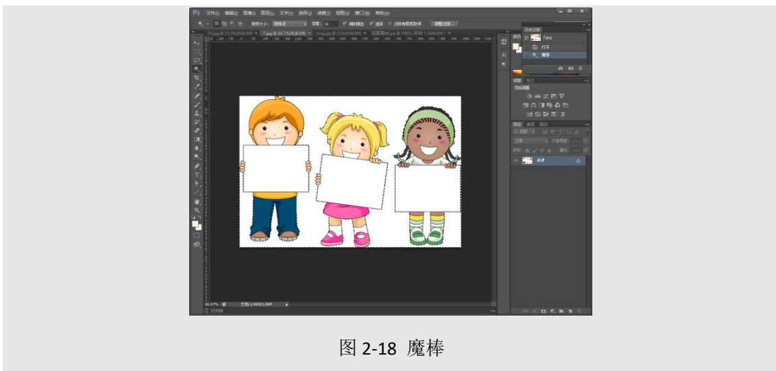
图 2-18 魔棒

(4) 魔棒：鼠标点击，与点击区域相连且颜色在色差范围内的区域均处于选中状态。一般用于选择颜色单一的背景，然后执行选择-反向，选中目标内容移出。