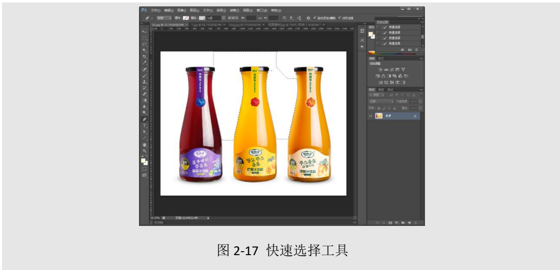
图 2-17 快速选择工具

(4) 魔棒：鼠标点击，与点击区域相连且颜色在色差范围内的区域均处于选中状态。一般用于选择颜色单一的背景，然后执行选择-反向，选中目标内容移出。