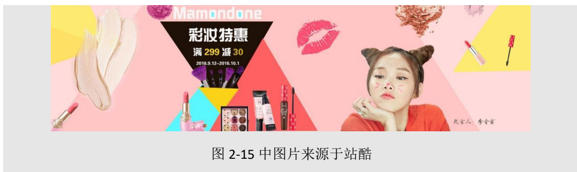
图 2-15 中图片来源于站酷

版面分割：指将呆板的一个版面分割为多个版面，使画面更有层次性、对比性，添加了感性和活力，有一定的视觉引导性。常见的版面分割形式有：圆形、方形、三角形、直线、曲线、斜线等。