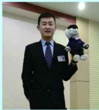
史百法 济宁市第二中学 首都航空公司空保