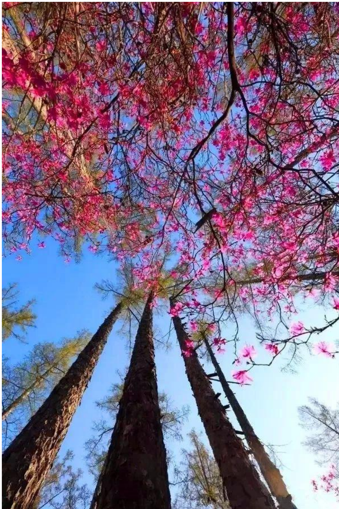
地址：伊春市红星区红星林业局大平台施业区