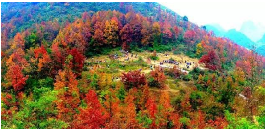
5.德保红叶森林公园