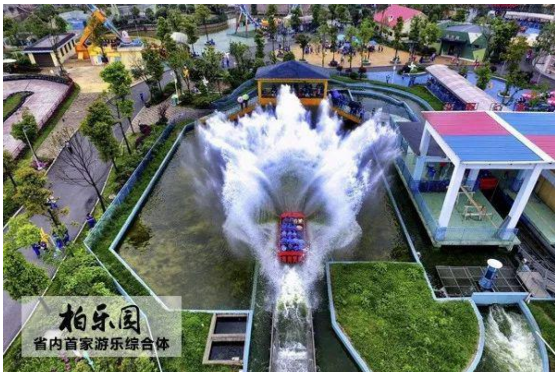
柏乐园 省内首家游乐综合体