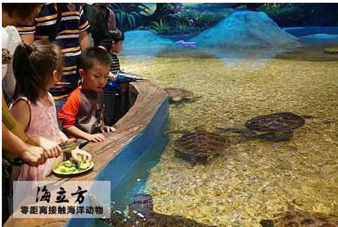
海立方 零距离接触海洋动物