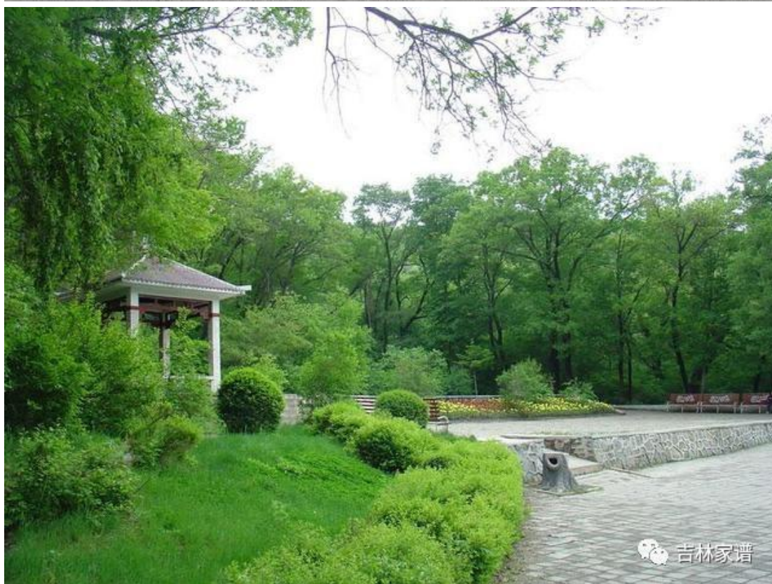
著名景观景点：春花、夏荫、秋叶、冬雪