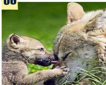
—走进狼岛“邂逅”草原狼—