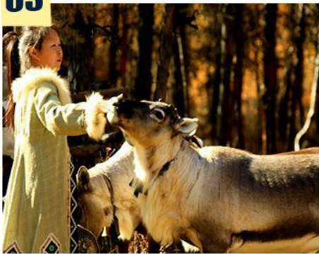
—走进鄂温克民族、喂驯鹿—