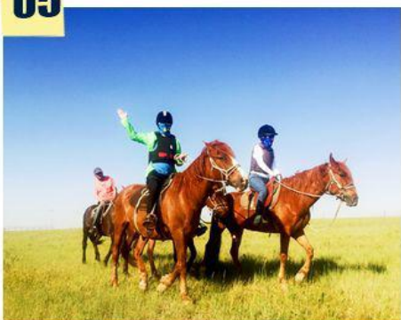
—纵马驰骋呼伦贝尔大草原—