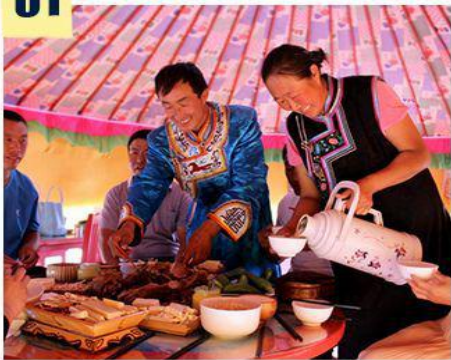
—走进蒙古包到牧民家做客—