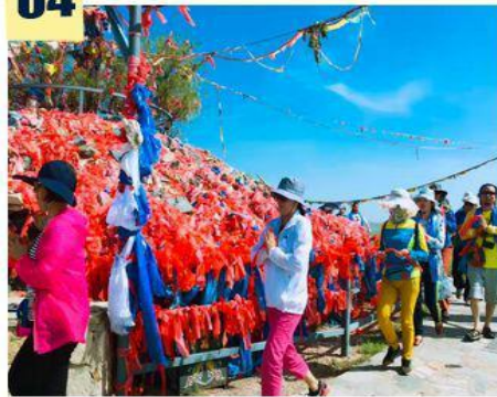
—蒙古族祭祀敖包寓意“万事大吉”—