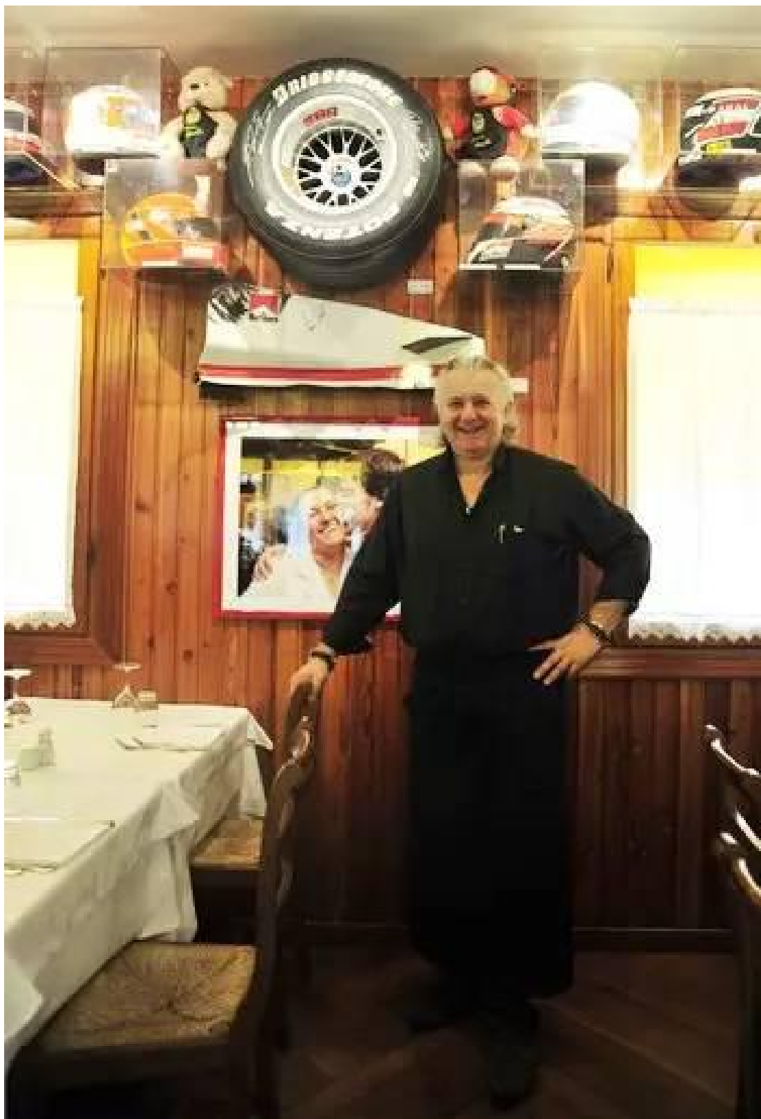
3 恩佐 · 法拉利之家