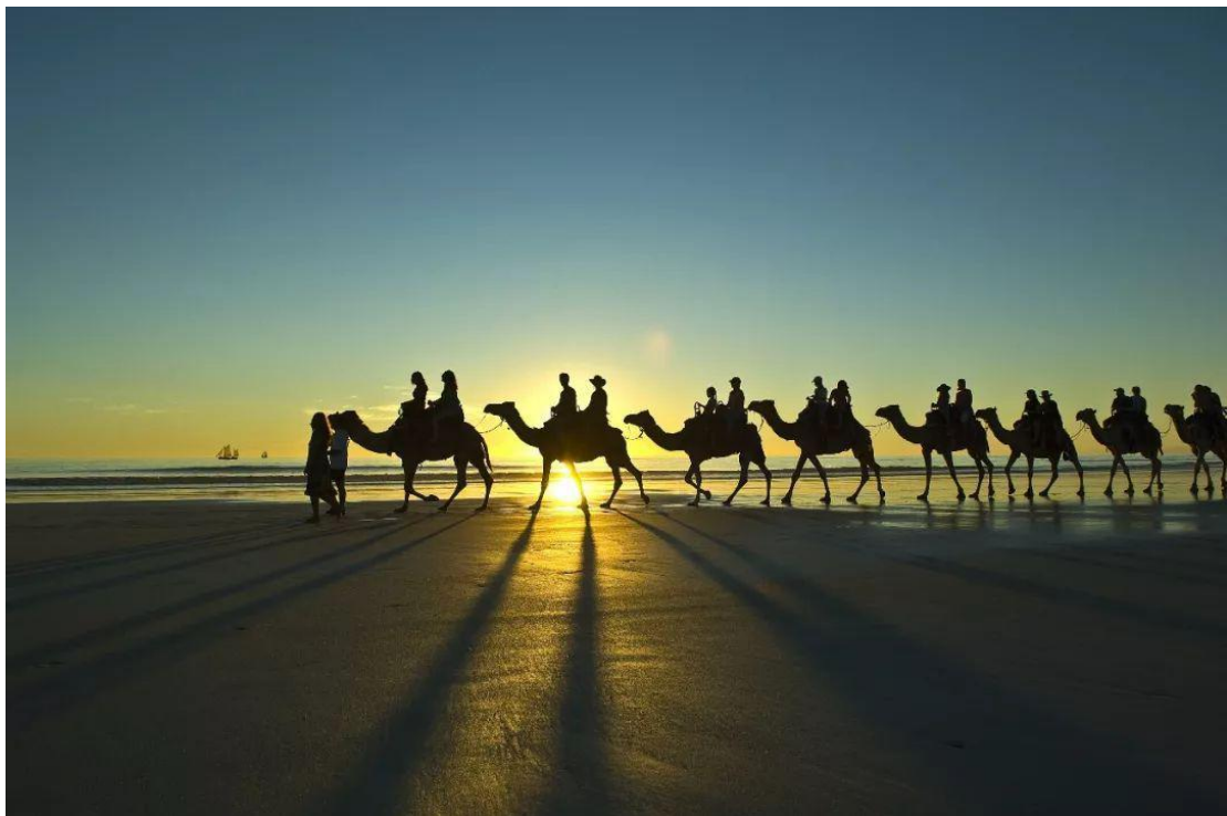
③ 布鲁姆（Broome）与日落 △