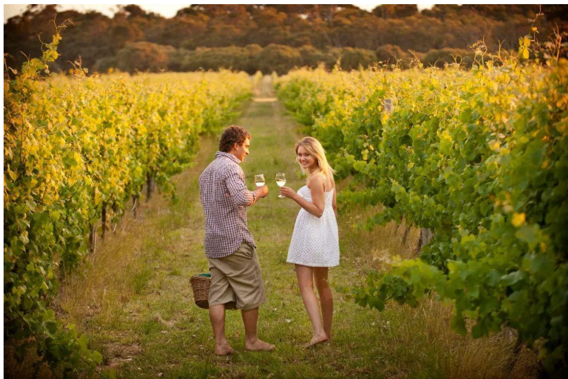
⑧ 玛格丽特河 (Margaret River) 与美酒、冲浪 △