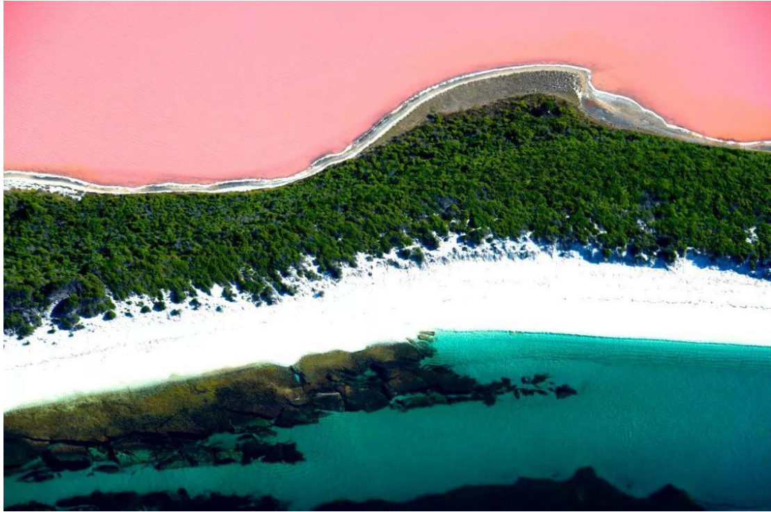
② 粉红湖（如赫特潟湖 Hutt Lagoon、希利尔湖 Lake Hillier、沃登湖 Lake Warden 等）△