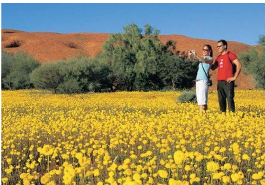
⑨ 西澳野花之旅 △