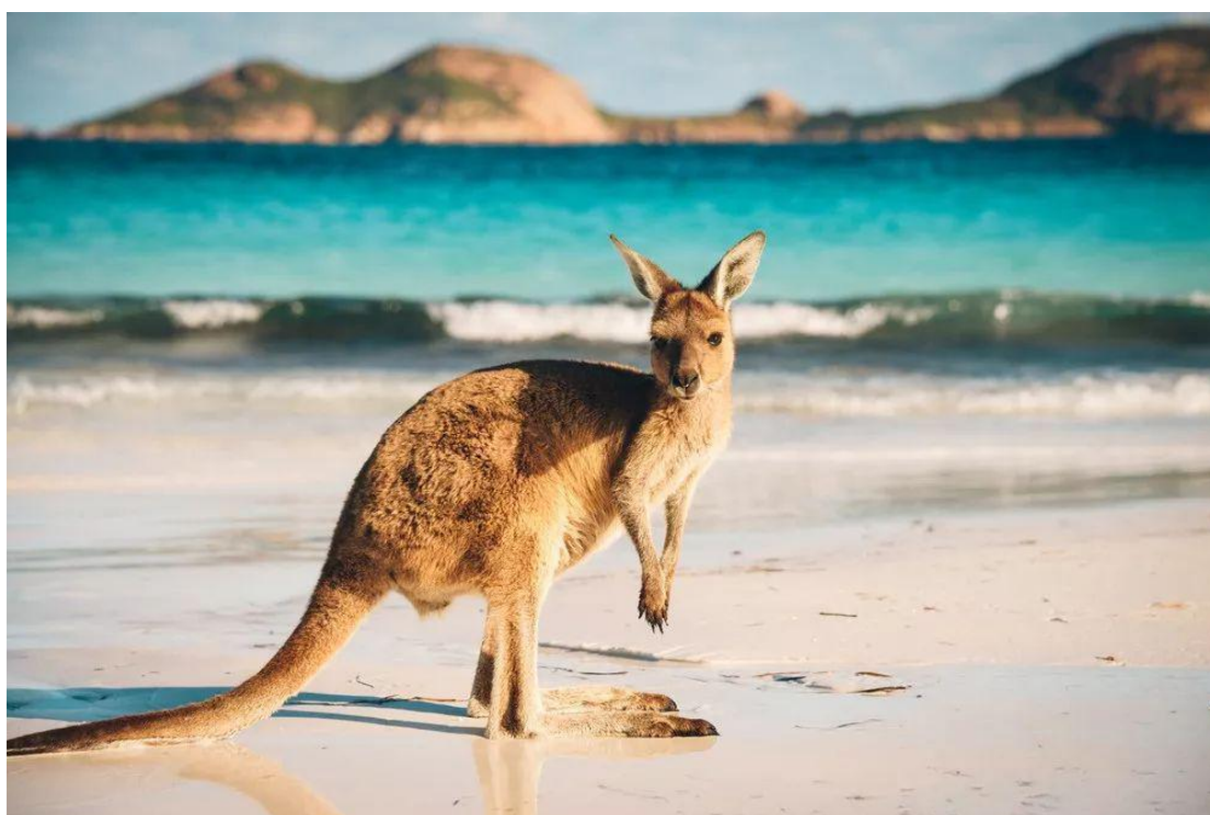
⑤ 白沙滩 (Lucky Bay) 与袋鼠 △