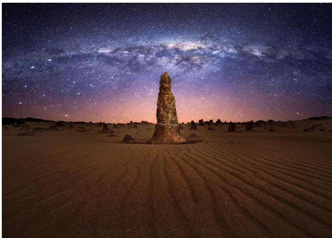
⑦ 尖峰石阵 (Pinnacles) △