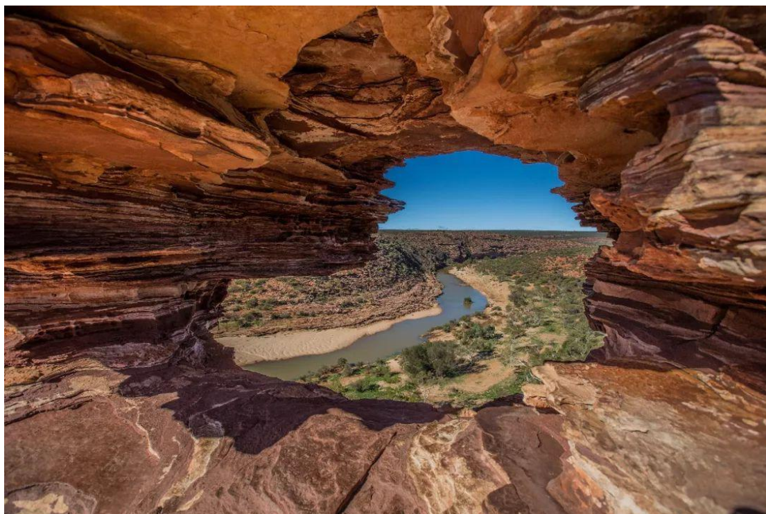
④ 卡尔巴里国家公园 (Kalbarri National Park) △