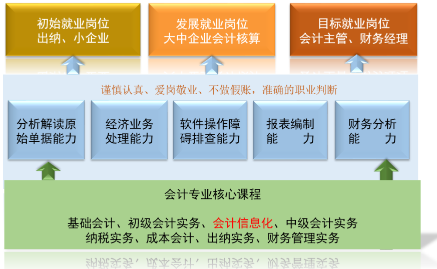
图：专业课程、能力、岗位关系一览表

助力其实现职业长远发展，同时为教师提供优质备课素材，提升备课效率，提高教学效果。