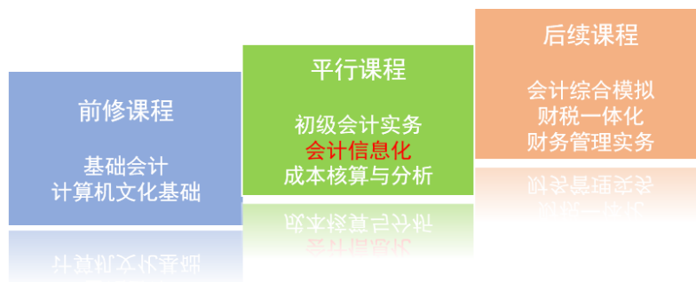
图：《会计信息化》课程衔接关系

课程衔接关系： 《会计信息化》开设于第二、三学期，在学生具备了基本的计算机操作能力，掌握了会计基本理论和业务的基础上予以开设，通过本门课程的学习，为学生后续进行综合会计实训及相关财税软件的学习奠定了基础，在整个专业课程体系中起着承上启下的作用。为毕业生从事信息化企业的财务工作岗位提供了有力支撑。