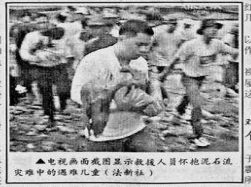
▲电视画面显示救援人员怀抱泥石流受害者中的遇难儿童。

参加救援行动的人, 正乘直升飞机赶赴灾区, 还有更多的人从海上赶来。另外, 来自菲律宾的搜救队也已经抵达灾区。