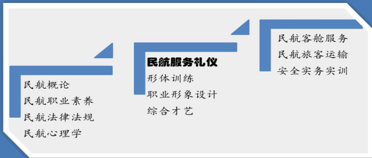
图2 前导平行后续课程示意图

本课程在大学一年级第二学期开设，前导课程有： 民航概论 、 民航法律法规 、 民航心理学 等，平行课程有： 形体训练 、 职业形象设计 、 综合才艺 等，后续课程有： 民航客舱服务 、 民航旅客运输 、 安全实务实训 等