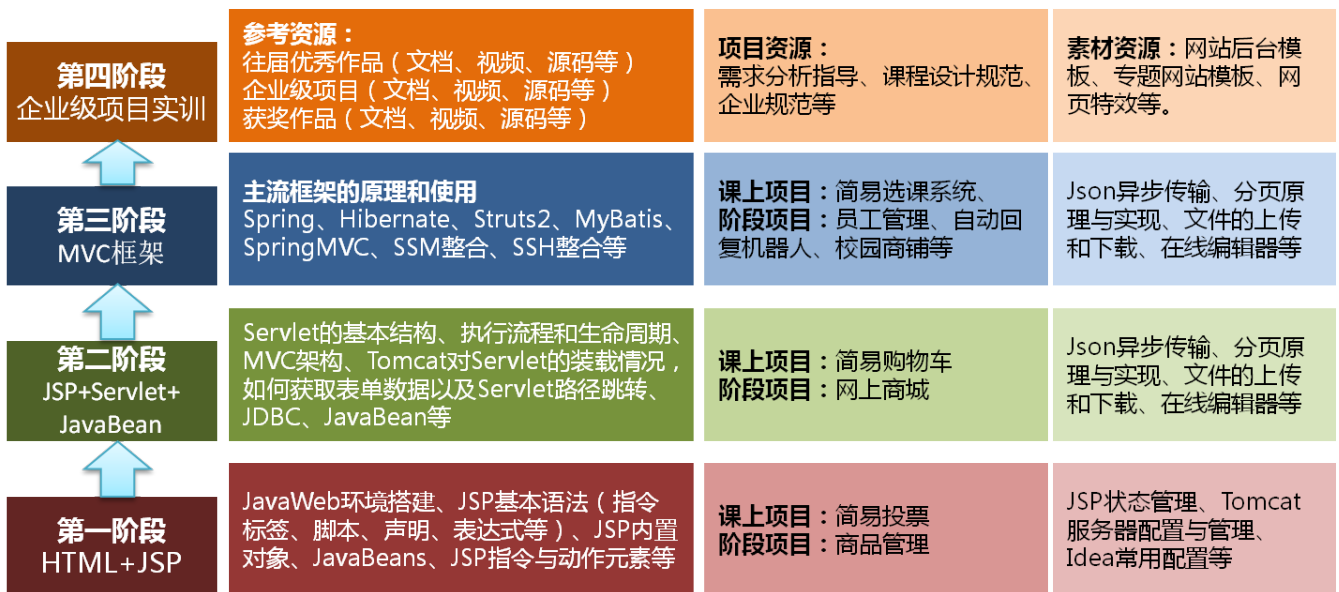
图 教学内容组织，以《JSP 基础语法》为例

(3) 拓展 ：对于不常用难度又较大的知识点做成拓展资源供有余力的学生自学，如Spring boot 框架、课外拓展项目等。